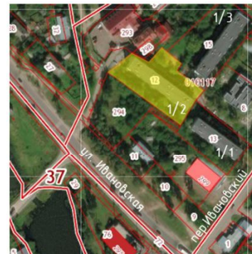
Экспликация элементов на плане