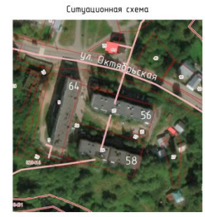
Экспликация элементов на плане